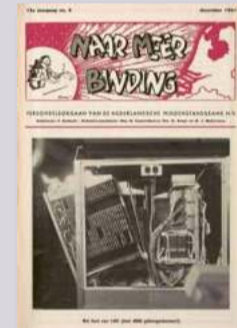
◀ Voorpagina "Naar Meer Binding" met foto van interieur IBM 1401

De introductie van de IBM 1401 was een groot succes en in 1963 had de Postcheque en Girodienst dan ook al het besluit genomen om vijftien van deze machines aan te schaffen. Het begin van de automatisering en daarmee ook de latere digitalisering van het Nederlandse geldverkeer was daarmee een feit.