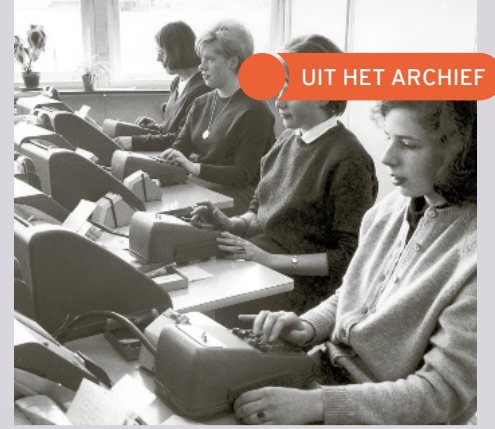
▲ 1965. Codeersters in het codeercentrum van PCGD aan de Kangoeroestraat in Breda.